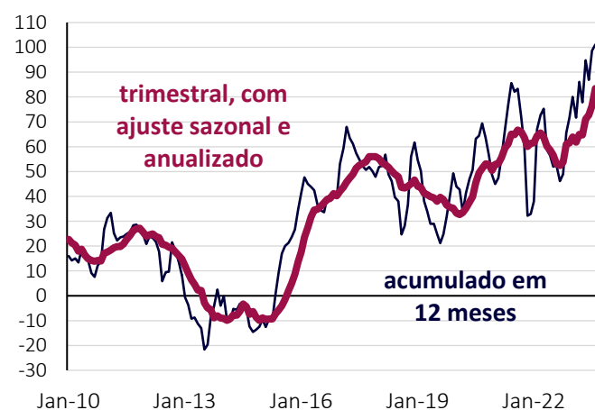
Gráfico 1. Brasil: Balança Comercial (USD bilhões)

Assim, atualizamos nossa projeção de superávit comercial para 2023 de USD 75 bilhões para USD 80 bilhões. Para o próximo ano, estimamos superávit comercial de USD 65 bi, o terceiro maior resultado da série histórica (Gráfico 2). As exportações deverão ser beneficiadas pelo aumento da produção de petróleo e de soja, enquanto as importações crescerão com a retomada da demanda doméstica devida à redução da taxa de juros.